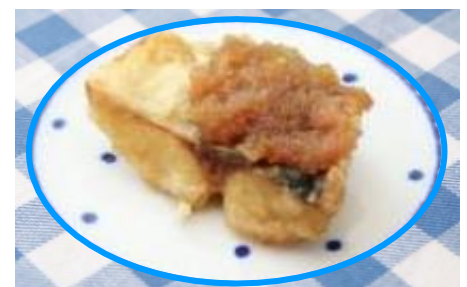
人気のメニューです！